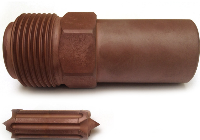
Filtres TPF1 et buses à embout amovible avec traitement V.A.R.