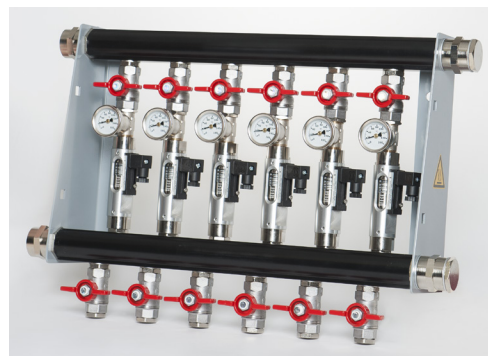
Sortie alarme en option

Les débit-mètres série DM sont utilisés pour mesurer et surveiller les fluides et se caractérisent par leur design compact et robuste. Les fonctions de mesure et de surveillance des débit-mètres peuvent être personnalisées pour chaque application spécifique au client. Il assure une régulation précise grâce à un débit d'eau contrôlé et continu pour tout types d'applications.